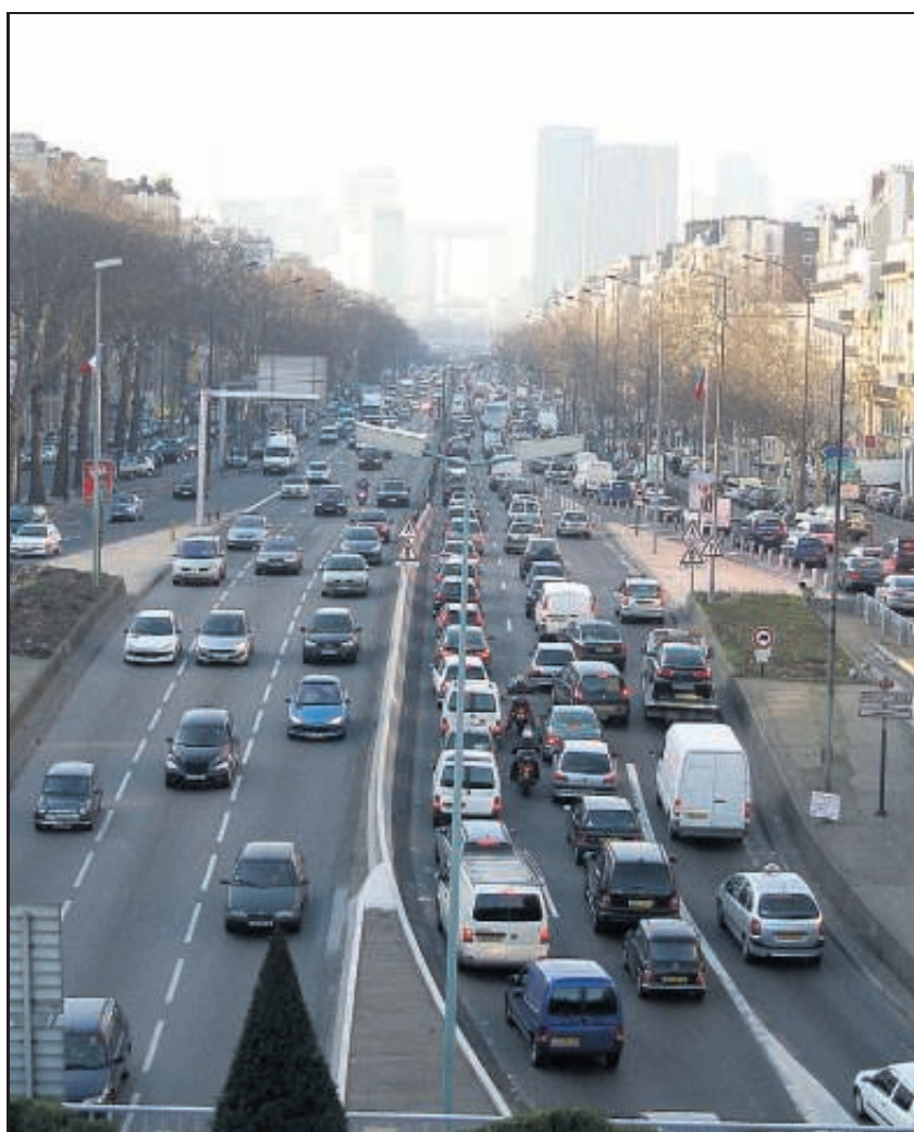
NEUILLY-SUR-SEINE, AVENUE CHARLES-DE-GAULLE. Un premier pas vient d'être fait avec la mise en place du comité de pilotage pour l'enfouissement de la N 13. Reste l'essentiel : trouver le financement du projet.